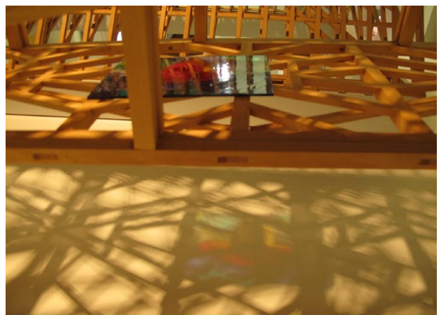
Aufnahmetechnik im Zeughaus / Grubenmann Museum / Teufen