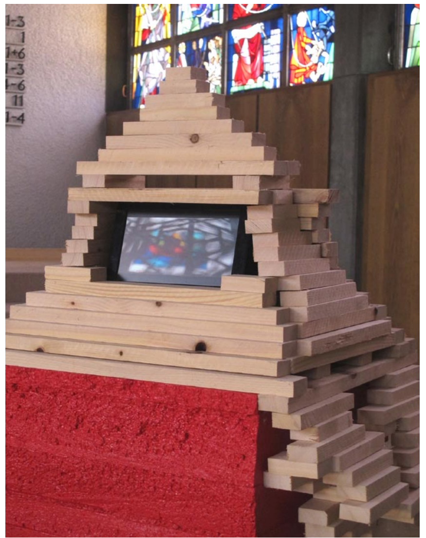
Tag 8 auf dem Bildschirm